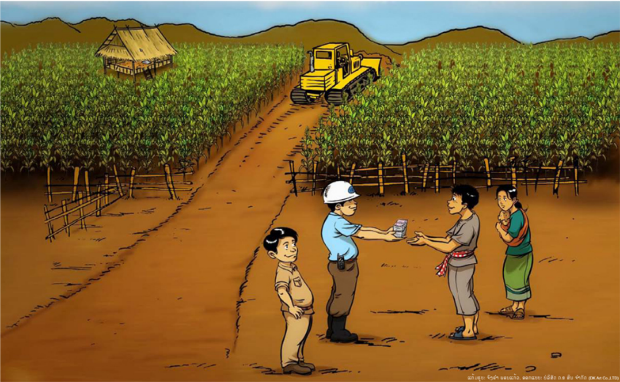
ແຜນສູນ: ຈິງຢ້າ ນອນແກ້ວ, ສອກແບບ: ບໍລິສັດ ດ.ສ ສິນ ຈ້າງດີ (P&A Co., LTD)

ດຳລັດຂອງນາຍົກລັດຖະມົນຕີ ວ່າດ້ວຍ ການທົດແທນ ຄ່າເສຍຫາຍ ແລະ ການຍົກຍ້າຍຈັດສັນ ປະຊາຊົນ ຈາກໂຄງການພັດທະນາ, ສະບັບເລກທີ 192/ນຍ, ລົງວັນທີ 7 ກໍລະກົດ 2005 ມາດຕາ 6 (ວັກທີ ໜຶ່ງ). ຫຼັກການທົດແທນຄ່າເສຍຫາຍ